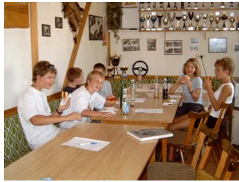
... auch drinnen hat's geschmeckt ...

Nach diesem „Vesper“ verlagerten wir das Programm zum Festplatz am See, um mit den „Kiddis“ den Parcours zu fahren. Dies war aber gar nicht so einfach, denn jeder wollte der/die Erste sein!