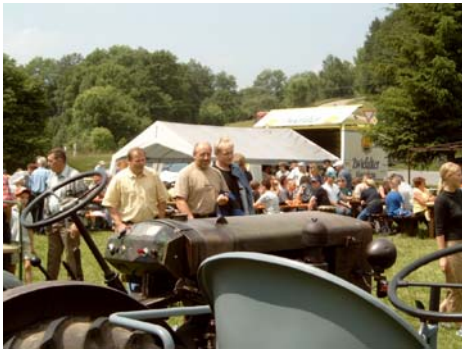
... war ganz schön was los ...

Man traf sich dann aber bei Grillwurst und Getränken wieder. Nach Erfahrungsaustauschen etc. trat man dann am Spätnachmittag die Heimreise ins Tal an.