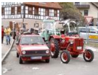
Pause in Seeburg