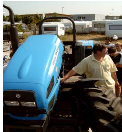
... aber auch der „Neue“ kann sich sehen lassen ...