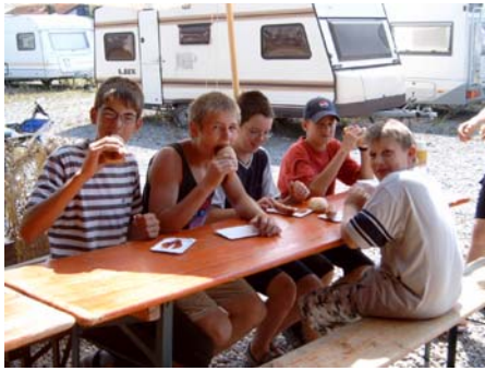
... mhh, lecker, so ne Rote Wurst ...