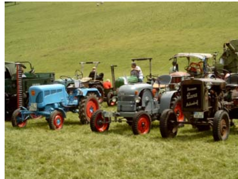
... unsere Traktoren ...