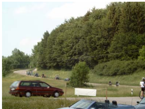
... auf geht's nach Hause ...